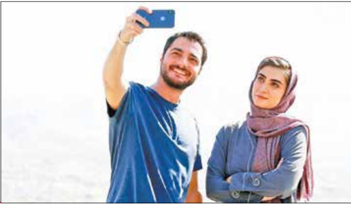
علانی از سریال سقوط

نه! این نگاه به قصه‌گویی در کانون همه‌جانبه است، آنجنان که در بخش تولید و انتشارات هم آن را جدی دنبال می‌کنیم. بگذارید اشاره‌ای به پیشینه جشنواره داشته باشم. جشنواره قبیل از آنکه شاهد شکل‌گیری این رویداد فرهنگی باشیم، طرحی به نام «اراکر میهمان» اجرایی می‌شد. به‌طور مثال وقتی که مربی در یکی از مراکز ما مصه می‌گفت، شرایطی فراهم می‌شد تا