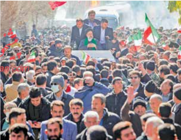
استقبال مردم شهر خاتم از آیت الله رئیسی

اکبری در سال ۱۳۸۷ به اتهام جاسوسی دستگیر شد، اما اگر چه پس از طی مراحل قضایی با اخذ تعهد مبنی بر عدم ارتباط‌گیری مجدد با