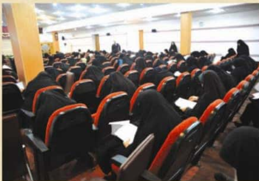
آزمونهای ویژه خواهران - واژه های آسمانی - ۱۳۹۲

از جمله ویژگیهای این طرح آن است که علاوه بر آزمونهای مستمر که در هر مرکز به صورت جداگانه برگزار می شود امکان برگزاری این آزمونها در قالب مسابقات و ... در سطحی گسترده تر بین مدارس، مساجد، دانشگاهها و مراکز متعدد نیز وجود دارد که ضمن اینکه خود کاری تبلیغی و ترویجی است. بسیار با شکوه است و می تواند مورد توجه رسانه ها و عموم افراد جامعه قرار گرفته و در نتیجه اقبال عمومی را در پی داشته است.